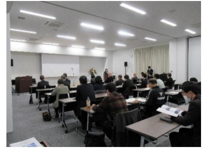
水質保全研修会の様子