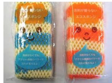
普及啓発資料（エコスポンジ）

ウ 水切り袋、キッチンペーパー、エコスポンジ、紙ストロー、エコバックを配布・作成 [2,680個 配布、2,852個 作成]